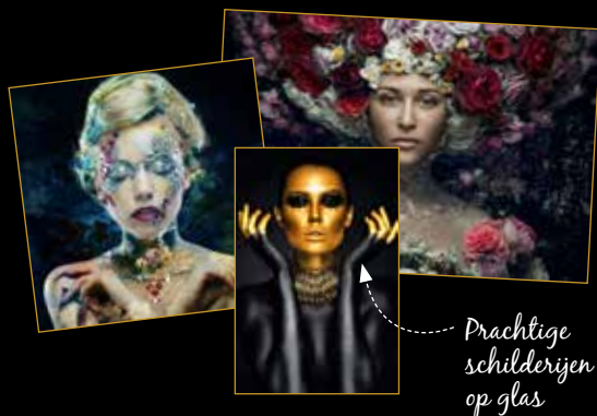
Prachtige schilderijen op glas